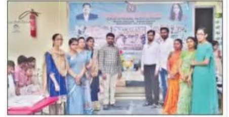
నారాయణ పాఠశాలలో వియార్థులు